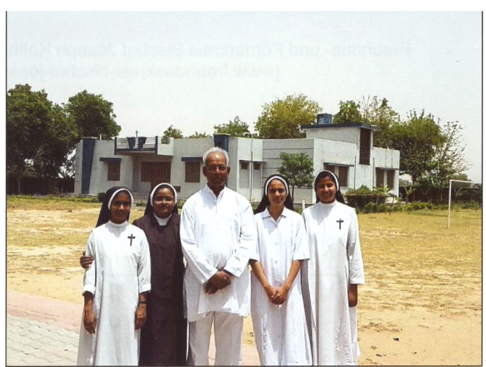
Klosterschwestern des Ordens: „Institute of our Lady of Carmel“. Die Schwestern unterrichten in der St. Pius School.