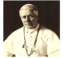
Papst Pius X

Liebe Freunde und Wohltäter von Bischof Joseph,